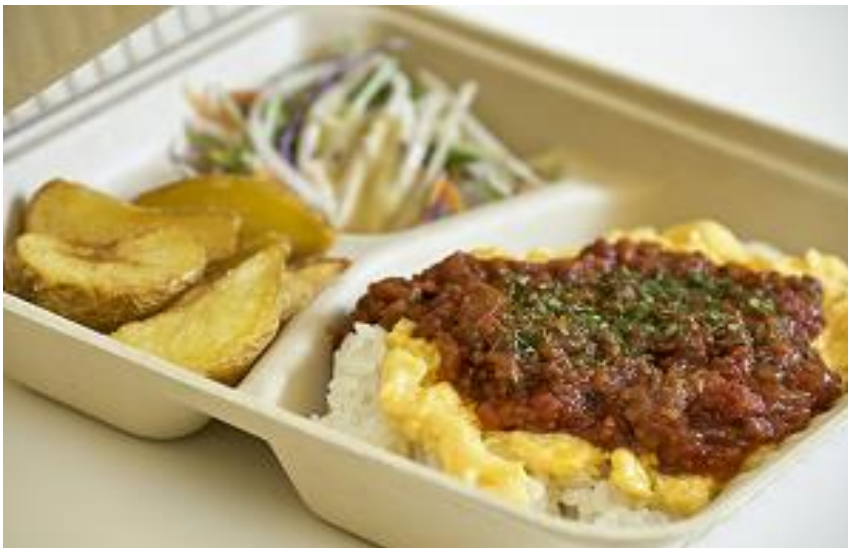
ランチBOX(えむらいす) 580円

華SAKU共通のショップカードでポイントを貯めよう！20ポイント貯まると200円の割引として使用できます！LINEでお友達登録をしましょう！