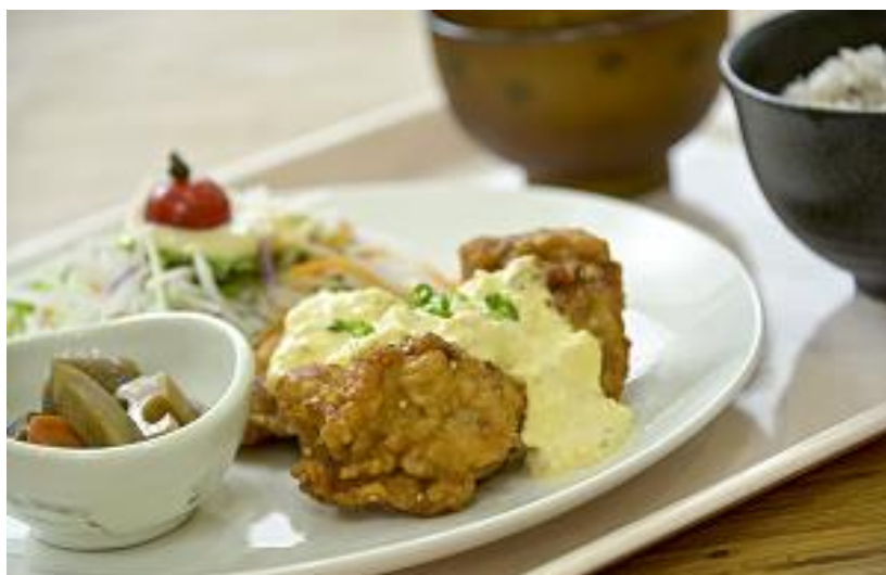
日替わりプレート(例)

華SAKU共通のショップカードでポイントを貯めよう！20ポイント貯まると200円の割引として使用できます！LINEでお友達登録をしましょう！