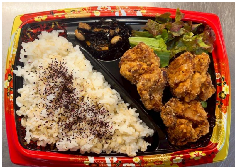
唐揚げ弁当(味噌汁付)

華SAKU共通のショップカードでポイントを貯めよう！20ポイント貯まると200円の割引として使用できます！LINEでお友達登録をしましょう！