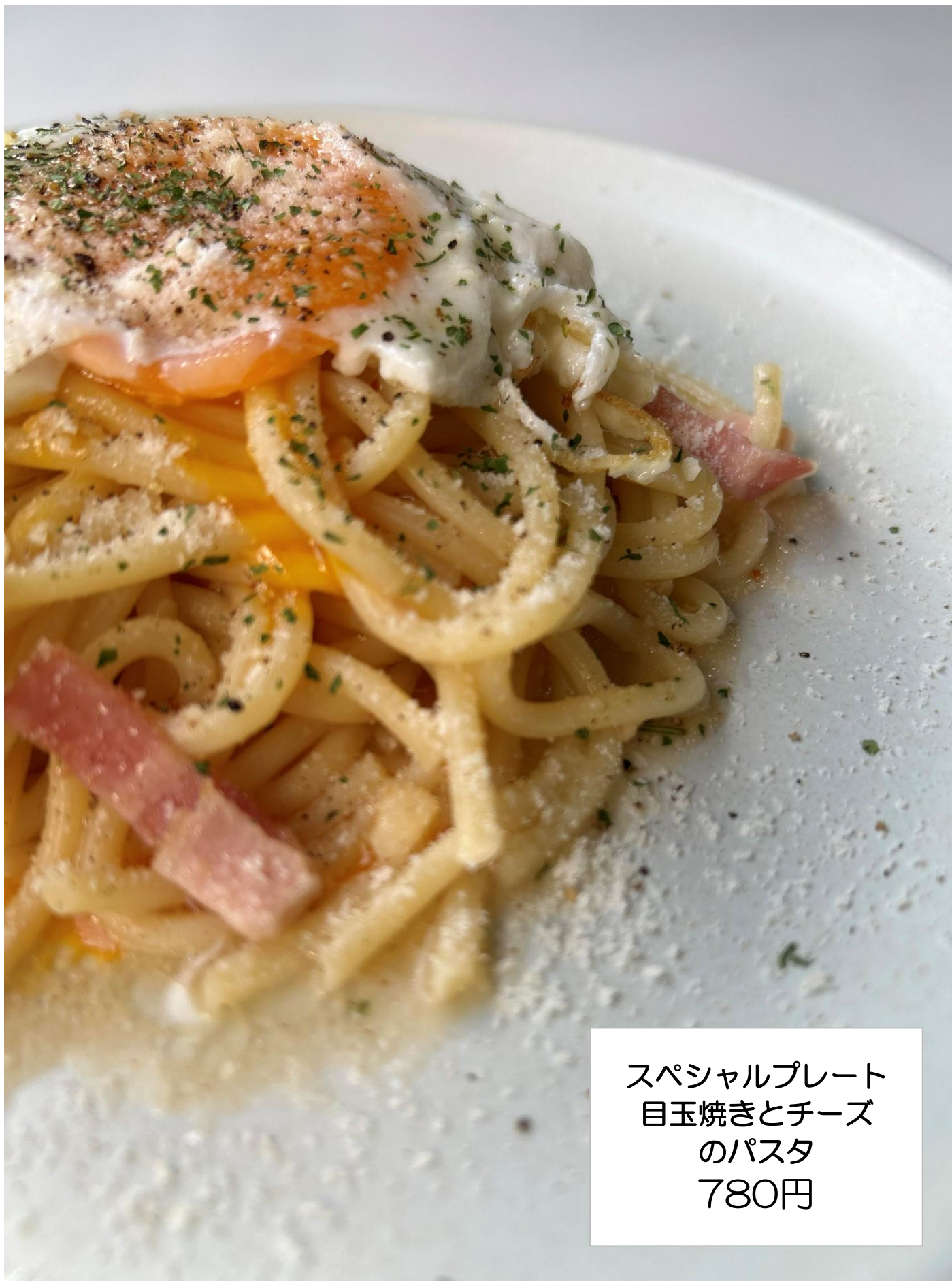
スペシャルプレート 目玉焼きとチーズ のパスタ 780円