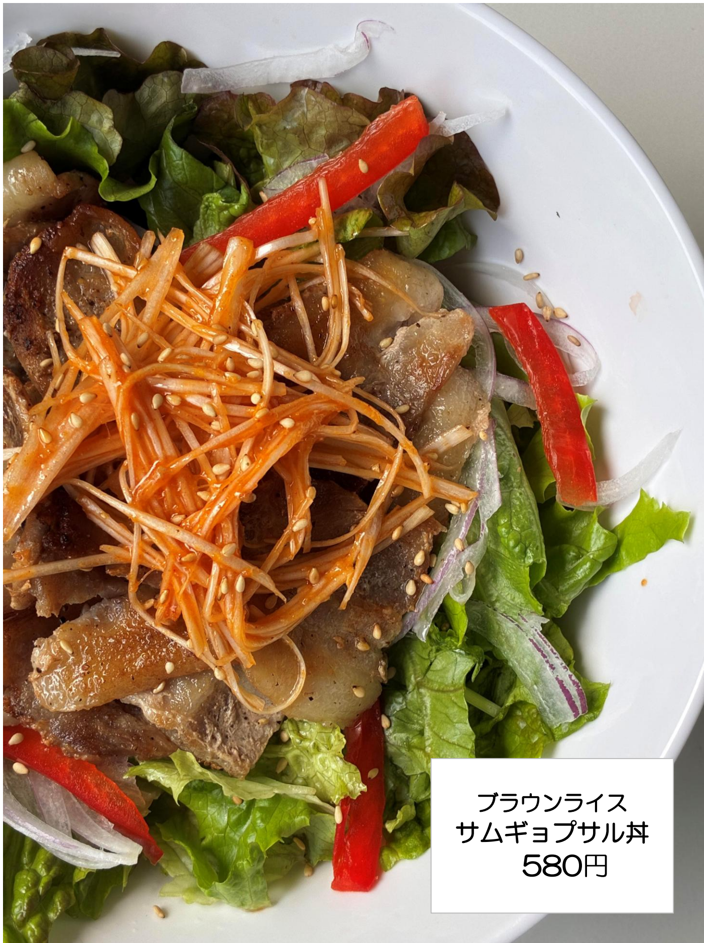
ブラウンライス サムギョプサル丼 580円