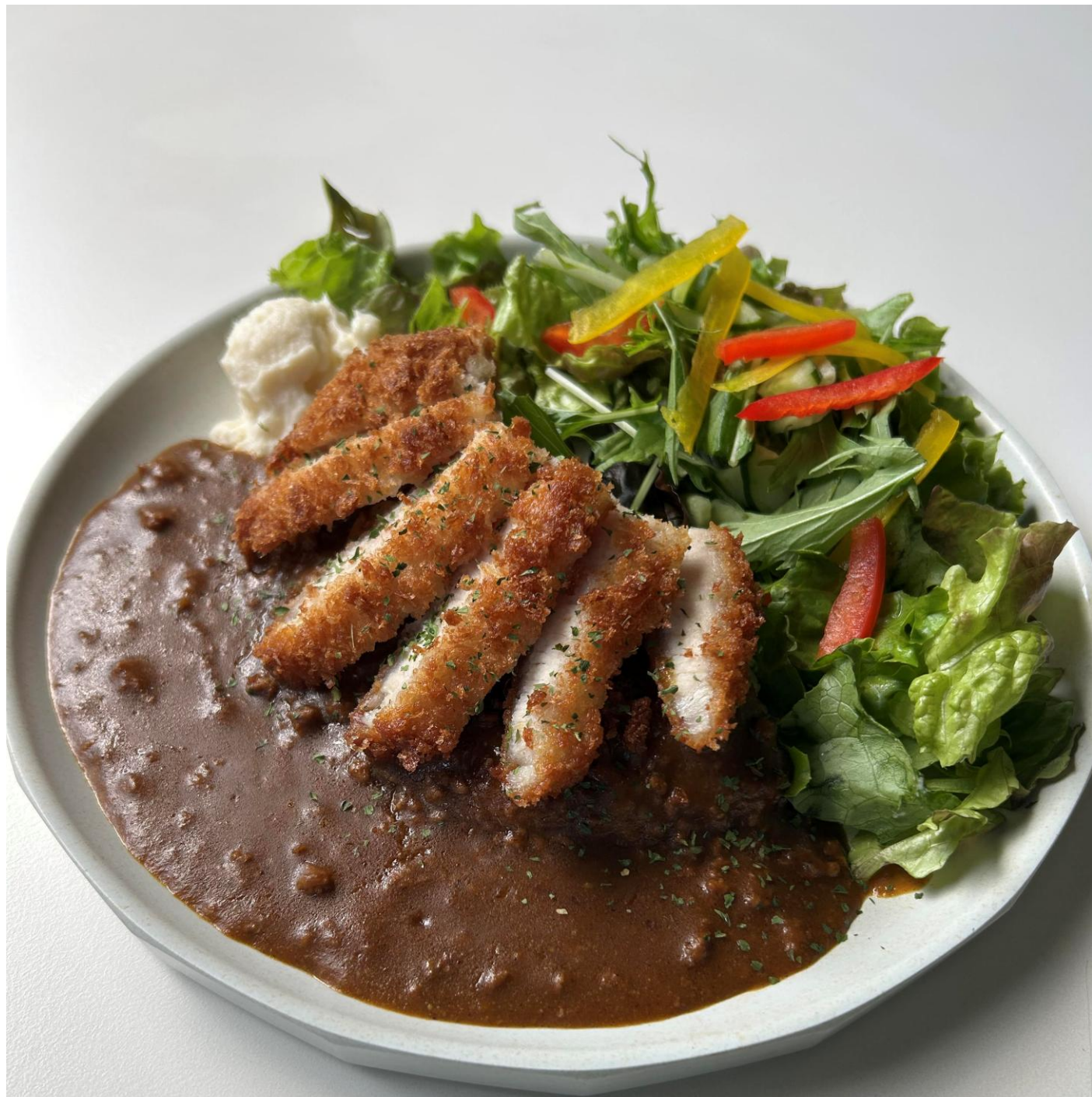
体育祭 ライスプレート ロースカツカレー 690円