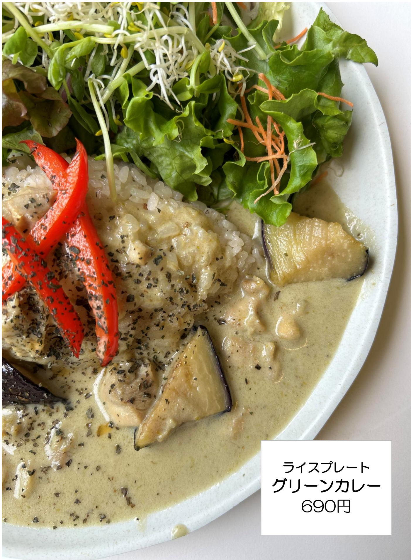
ライスプレート グリーンカレー 690円