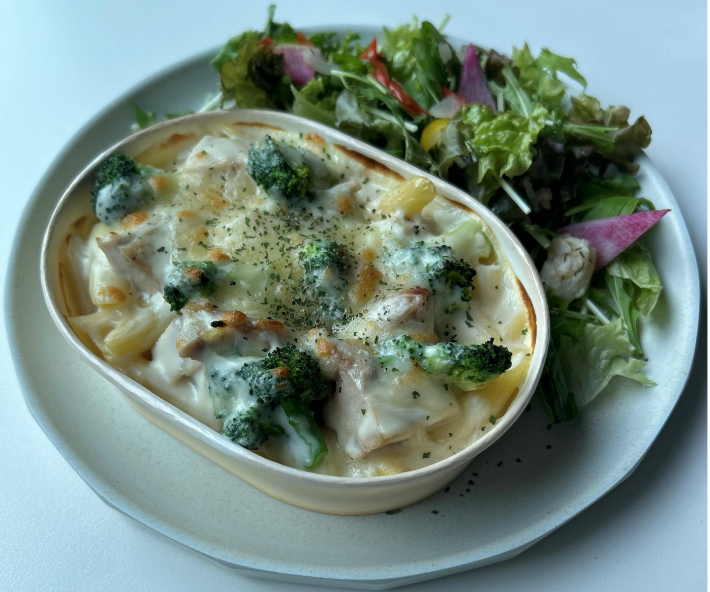
スペシャルプレート チキンとブロッコリーの グラタン 780円