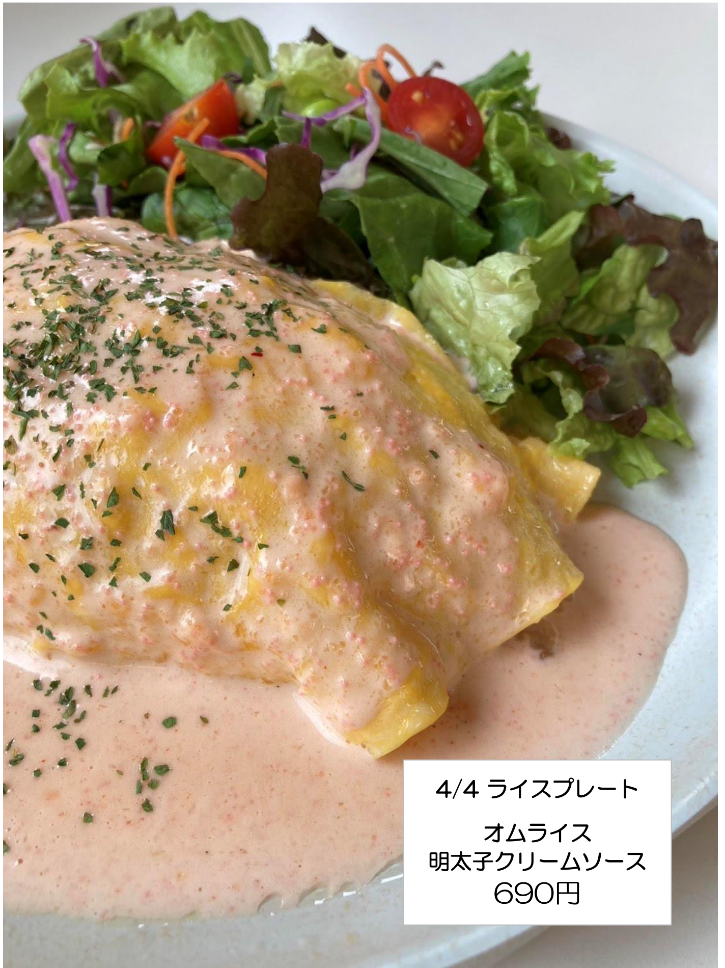
4/4 ライスプレート オムライス 明太子クリームソース 690円