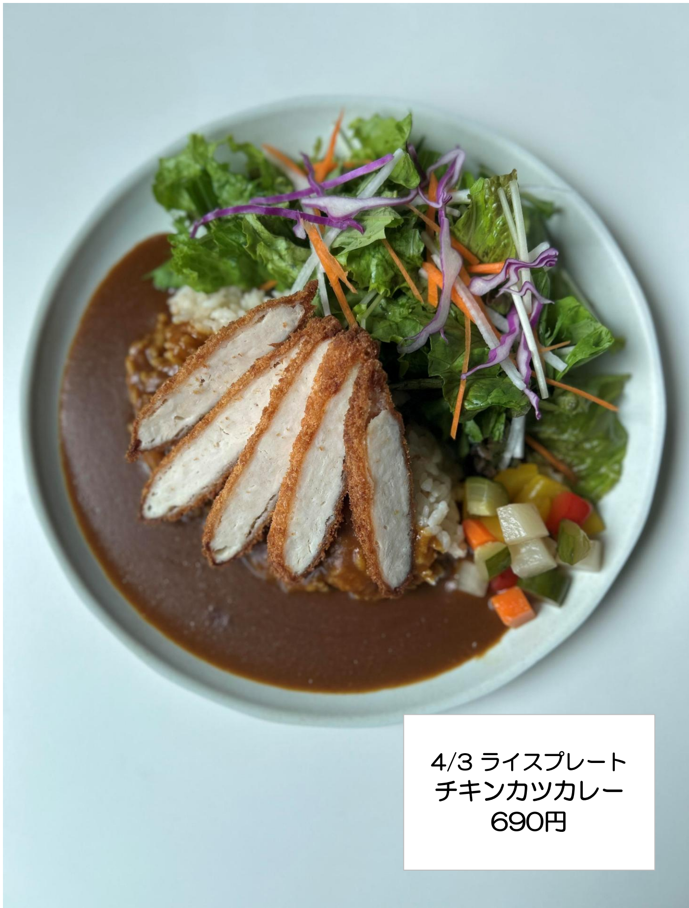
4/3 ライスプレート チキンカツカレー 690円