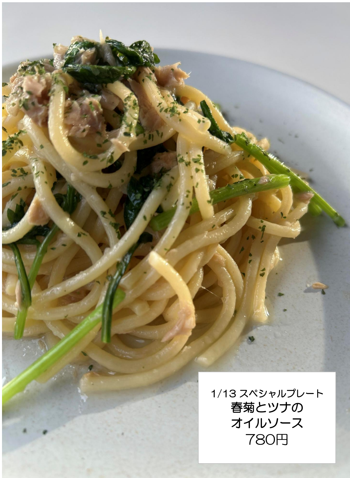
1/13 スペシャルプレート 春菊とツナの オイルソース 780円