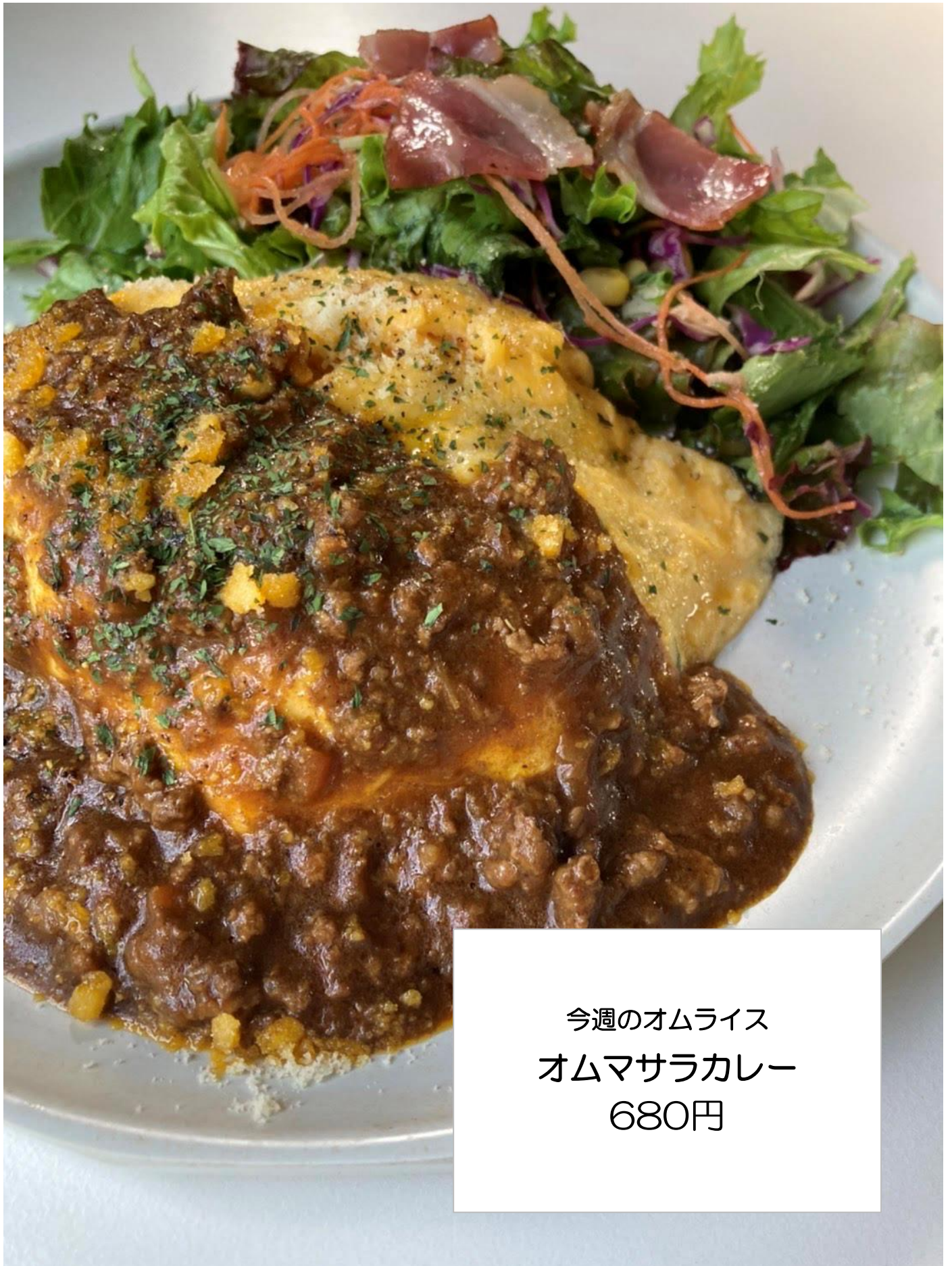
今週のオムライス オムマサラカレー 680円